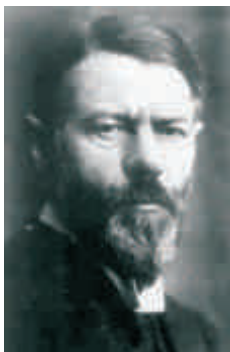
Max Weber, foi um intelectual alemão e um dos fundadores da sociologia

Relativismo - é a teoria filosófica que se baseia na relatividade do conhecimento e repudia qualquer verdade ou valor absoluto. Ela parte do pressuposto de que todo ponto de vista é válido.